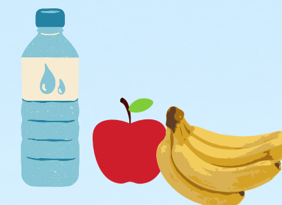
Вода, лекарства и питание (при необходимости)