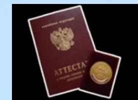
Аттестат или диплом выпускника СПО